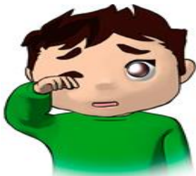
手で目をこすらない

かかってしまったら目も傷つき、学校にもいけない、勉強も遅れてしまう、遊びにもいけない・・・なんとしても 予防 していきましょう！！