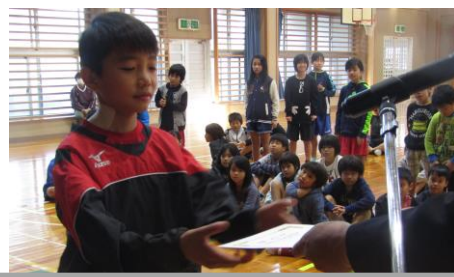
表彰朝会では、多くの児童が表彰されました。漢検・伊是名検定・スロージョギング・頑張リノート・・・等。