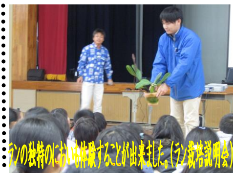
自分の独特の個性を表現することが出来た。(園栽培説明会)