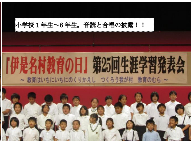
「伊是名村教育の日」第25回生涯学習発表会 ～ 教育はいちにいちにのくりかえし つくろう我が村 教育のむら ～