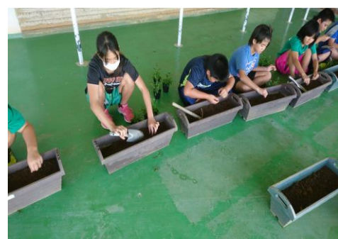
一生懸命育てます。一人一鉢運動