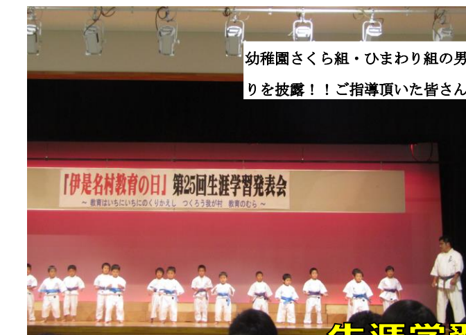
幼稚園さくら組・ひまわり組の男児は力強い空手の演武、女児は可愛い踊りを披露!! ご指導頂いた皆さん有り難うございました。

外国語活動が変わります。 新学習指導要領改訂（二〇二〇年度）に伴い来年度より（移行措置）高学年（五・六年）から「読むこと」、「書くこと」を加えて総合的に系統的に扱う教科学習を行うとともに、中学校への接続をはかることを重視しています。また、高学年への接続として、「聞くこと」、「話すこと」を中心とした活動を通じて