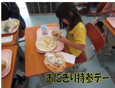
おにぎり持参デー